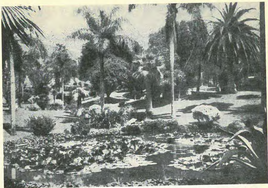
Att få våra åtta dagar i de här trakterna är väl något att träna för?! En bild från Monaco.

fjärde, 2 för femte och 1 för sjätte placering.